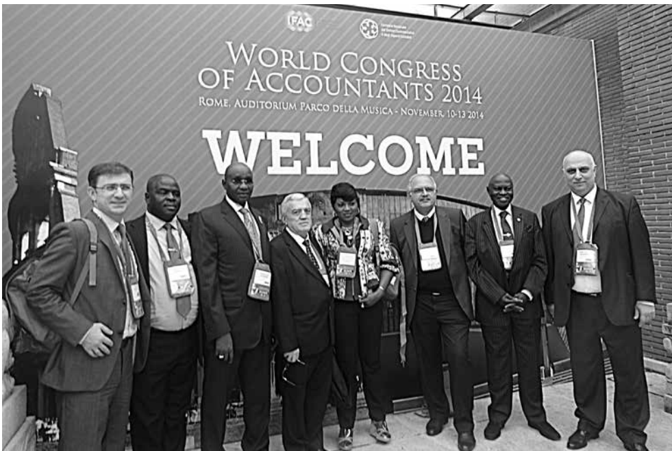
ბაფისა და ნიგერიის პროფესიული ორგანიზაციების წარმომადგენლები

ბუღალტერთა მე-19 მსოფლიო კონგრესში მონაწილეობდნენ საქართველოს პროფესიონალ ბუღალტერთა და აუდიტორთა ფედერაციისა (ბაფი) და პროფესიონალ ბუღალტერთა ინსტიტუტის წარმომადგენლები: